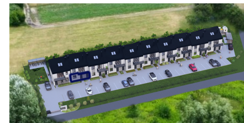
Widok z lotu ptaka