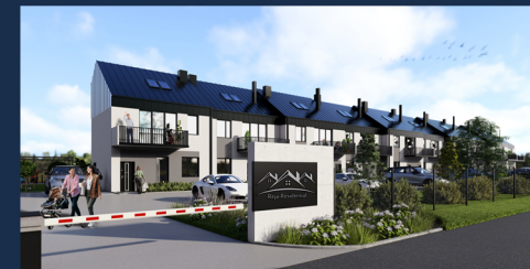
Widok od frontu

Energooszczędne i ekologiczne mieszkania w 3 linii zabudowy