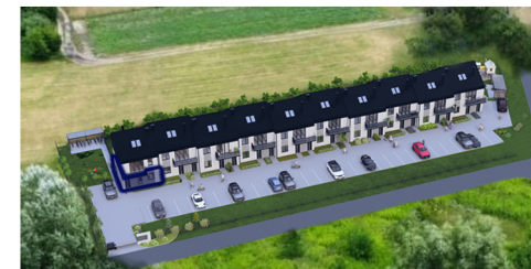
Widok z lotu ptaka